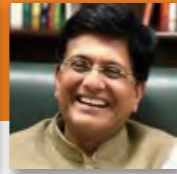
インド繊維省大臣： ゴヤル・ピユシュ