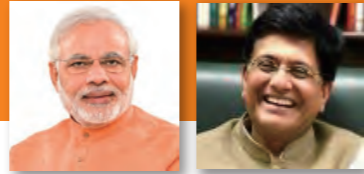
インド首相： ナレンドラ・モディ